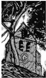
AMIS DE GROSROUVRE